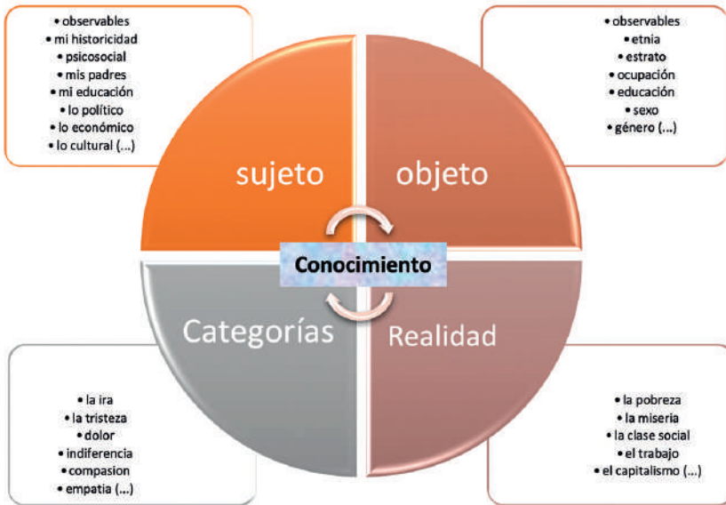
Gráfico realizado por los autores Valencia Grajales & Marín Galeano.

En el entendido que todas y cada una de las categorías, realidades, objeto y sujeto, se pueden descomponer en observables y, a la vez, permiten la acumulación, ello, a su vez, permite articular cada uno de los planos, haciendo lo más complejo para luego proceder a formular unos conceptos ordenadores de dichas realidades conforme a las áreas política, cultural, económica y psicosocial; esto, adicionalmente, permitiría la reconstrucción articulada de la realidad y del conocimiento por medio de la totalidad como elemento organizador del pensamiento del presente, sin desconocer el movimiento dialéctico de dicha realidad, haciendo de la praxis la potencialidad de los saberes evidenciados (Zemelman, 1992, 1994, 1996).