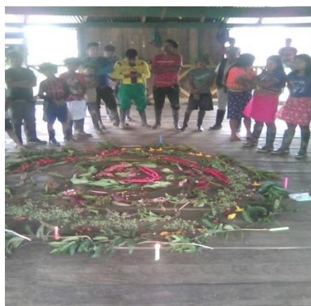
Ilustración 3 rito sobre prosperidad de cultivos

Lo ritual constituye un aspecto fundamental para la vida del pueblo indígena, desde la cercanía con la tierra como se compenetrán algunas simbologías ancestrales que cobran sentido y significado para la vida en comunidad 6 .