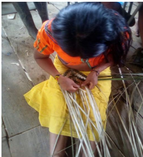
Ilustración 1 Trabajo en caña flecha