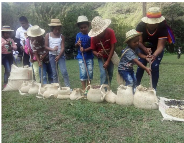
Ilustración 5 Ofrenda a la Madre Tierra.