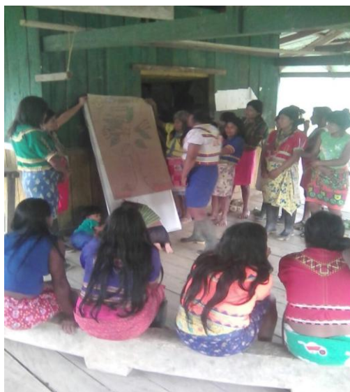
Ilustración 2 Reunión de mujeres

La tierra para los indígenas ha sido, a través de su historia, el elemento central, el núcleo de su cultura. Representa la suma de sus valores, de su historia, de su organización social y de su vida en común. La vida de los indígenas, sus costumbres, sus creencias, su