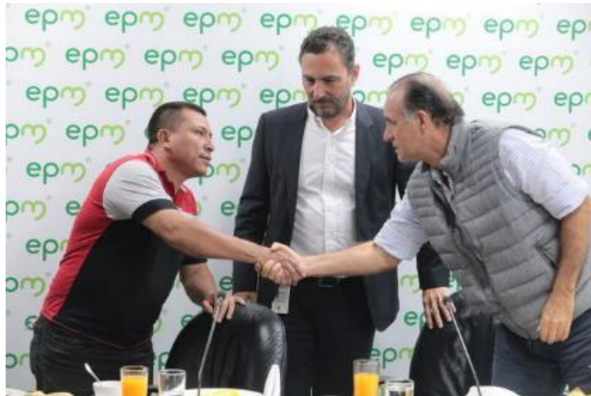
Nota. Reunión comunidad Nutabe y EPM.

Estos testimonios ayudan a entender la forma tan cuestionable como EPM procedió y llevó a cabo las cosas, y, por otro lado, permiten comprender la indignación, la tristeza y el dolor de la comunidad Nutabe. Además, explica la razón por la cual la comunidad se mantiene y conserva su lucha, pues, es consciente de que, pese a que se hayan logrado conseguir y recoger cosas en el camino de la participación política y social, aún falta mucho por recorrer y por obtener.