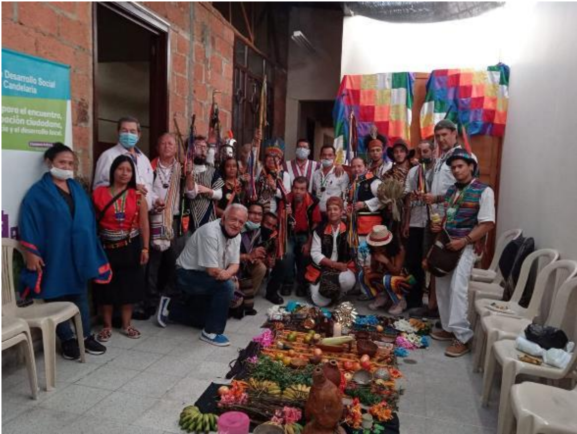
Nota: comunidad Nutabe.

Para finalizar, se ha podido lograr a través del encuentro directo con los miembros del cabildo Nutabe y por medio del análisis profundo de sus palabras mostrar que efectivamente el proyecto de Hidroituango ha producido procesos de subjetivación en la comunidad Nutabe que los ha llevado a tener que conquistar su identidad por otros caminos y desarrollar su resistencia y su lucha con medios impuestos que han debido ir conociendo y dominando para que su voz pueda ser escuchada, para no quedarse apagada en el olvido pues el silencio crea la historia contada por los vencedores. Sin embargo, esta lucha por el reconocimiento de su identidad hace que el espíritu Nutabe en algún sentido continúe unido a pesar de aquella forzada separación a que ahora se ve obligada su gente a tener que vivir.