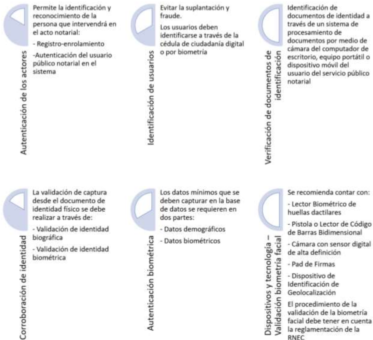
Figura 3. Registro, autenticación e identificación digital en las notarías en Colombia

pandemia del Covid-19, estos servicios de digitalización aumentaron, pues las necesidades derivadas de la pandemia así lo exigieron. Hoy en día, por ejemplo, un proceso de registro, autenticación o identificación digital en una notaría debe seguir los siguientes pasos: