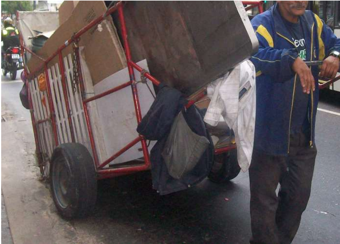
Figura 2. Reciclaje actividad económica principal del habitante de calle.

(Principal actividad económica que desarrollan los habitantes de calle la cual es el reciclaje.)