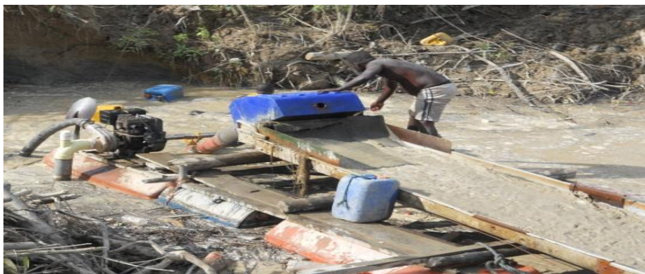
Figura 4. Motobomba

En tercer lugar , la minería mecanizada , se ejecuta con retroexcavadoras, dragas, buldóceres, motobombas de gran capacidad, mangueras, volquetas y sustancias químicas como el mercurio y el cianuro. Esta clase de minería se empezó a realizar en la década de los ochenta primero por actores foráneos y luego por grupos armados al margen de la ley, que son quienes hoy operan en la región objeto de los hechos del caso sub examine , desplazando a los mineros tradicionales e imponiendo nuevas formas de realizar la minería de forma ilegal, masiva e indiscriminada 196 .vease figura No 4.