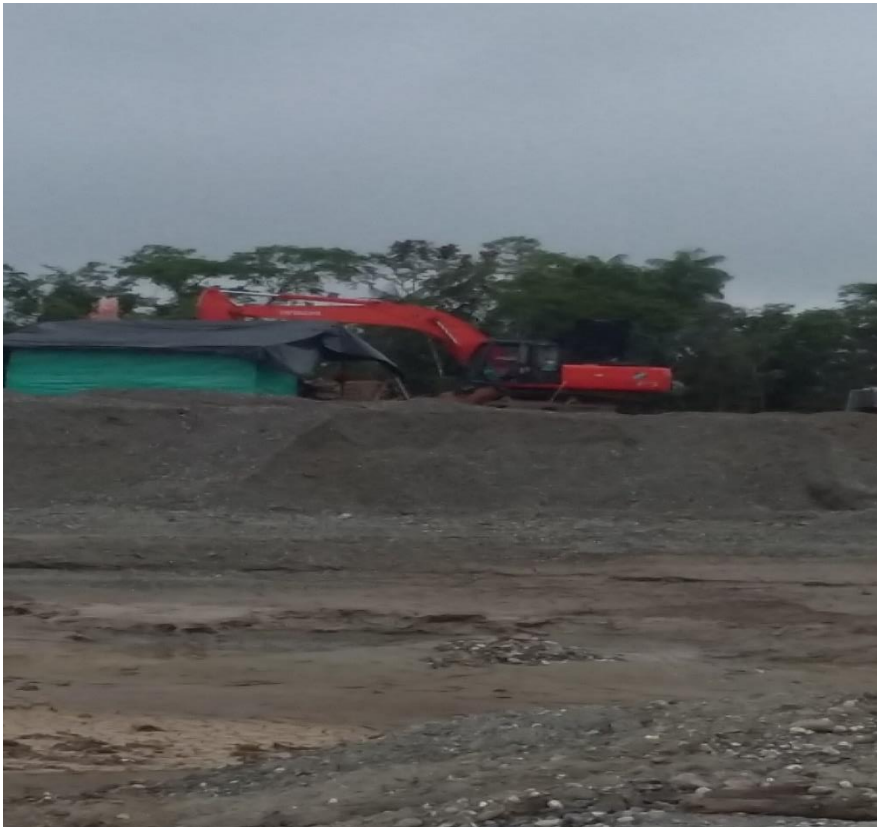
Figura 12. Excavación de tierra

La actividad minera municipal con la utilización retroexcavadoras han producido grandes excavaciones de tierra, como se ve en la figura N° 12, presencia de químicos contaminantes del agua como se pudo comprobar en estudios realizados por el Instituto de Investigaciones Ambientales del Pacífico, donde comprobó la presencia de mercurio en el Rio Quito.