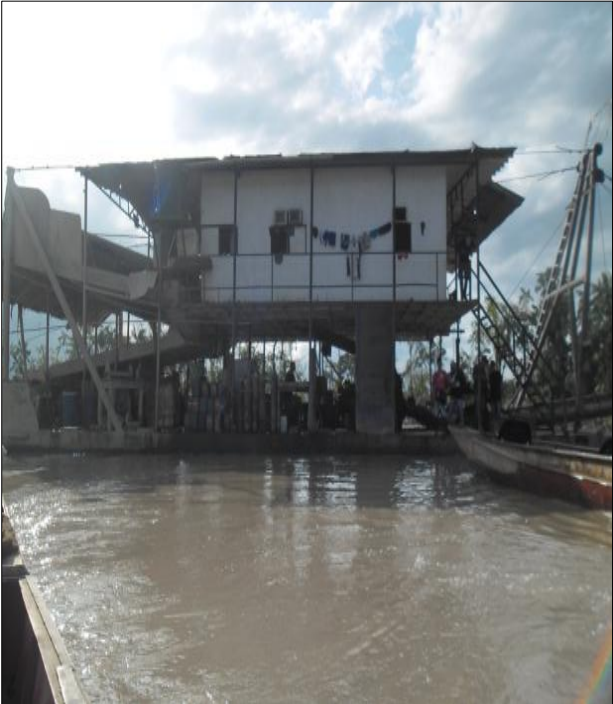
Figura 8. Draga Dracolbra vista interior