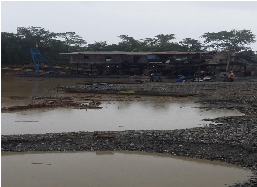
Figura 10. Daños ambientales causados por la minería

Además de los diferentes impactos ambientales, minera desarrollada en el municipio por medio de dragas de succión y retroexcavadores ha conllevado todo tipo de alteraciones en el entorno natural de las comunidades, al generar deforestación, alteración en el cauce de los ríos, contaminación de proporciones altamente riesgosa para la vida e integridad de los individuos y comunidades, y con ello un crítico panorama arrasador, como se observa en la figura No 10.