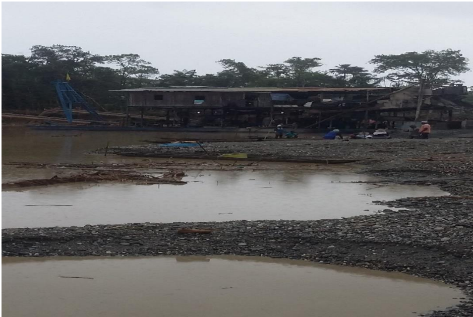
Figura 13. Daño a la tierra causada por la minería

Liberación de sustancias tóxicas. De conformidad con estudios realizados por el Instituto de Investigaciones Ambientales del Pacífico, las aguas se encuentran contaminadas por mercurio, siendo muy perjudiciales para la vida en el medio natural y la biodiversidad local y regional.