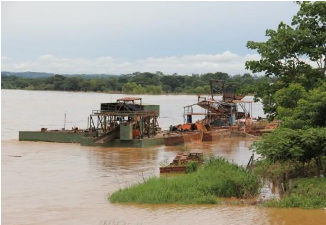
Figura 14. Draga brasilera

De acuerdo con la investigación de la Fiscalía, “el daño ambiental ya supera los mil millones de pesos y existe una alta probabilidad de que no se pueda restaurar. El uso de esta maquinaria más conocida como dragones brasileiros, debido a la procedencia de su creación, causa enormes daños al medio ambiente porque son construidos para arrasar con todo lo que quede a su paso durante día y noche” . Véase figura No. 14.