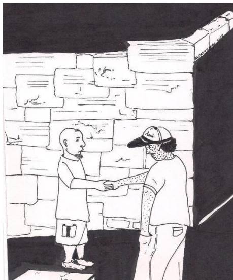
Orozco Henao Albany, 2019, ilustración. En la cárcel la amistad tiene un gran valor

Elaborar un concepto de justicia para dar a conocer su aplicación en Colombia es una situación trascendental en la medida en que existen muchas apreciaciones bastante controversiales, por cuanto la justicia en este país, está relacionada muchas veces con la situación de clase, con la posición de clase, con la aplicación de los mecanismos que se emplean de acuerdo con el sector de clase al que se pertenece para reclamar los derechos, con la práctica política de clase. En ese sentido se ha hecho evidente que en Colombia los sectores sociales de menos recursos deben percibir el concepto de la justicia desde otros puntos de vista, porque existe realmente una relación directa entre la justicia y la vida real.