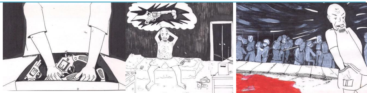
Orozco Henao Albany, ilustración. Parece que la culpa la tiene la cultura de la violencia

La culpa no hay que buscarla solamente en los actores, porque ella hace parte, como todos de una cultura de un país subdesarrollado como Colombia, un país donde el narcotráfico y la violencia, han hecho mucho daño y entonces ante esas circunstancias. La violación de los derechos a los reclusos, a los ciudadanos en general, a la mujer, a los líderes populares, es común y corriente, es parte de la vida cotidiana de los colombianos. Por esa razón, se pudiera decir, que la culpa es de todos los que no han querido cambiar, de los que piensan siempre, que lo más importante es castigar.