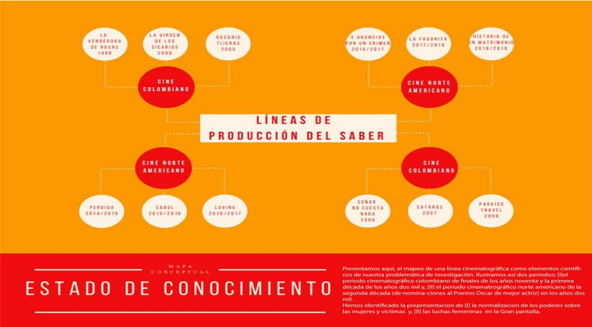
Gráfico. Línea de producción del saber