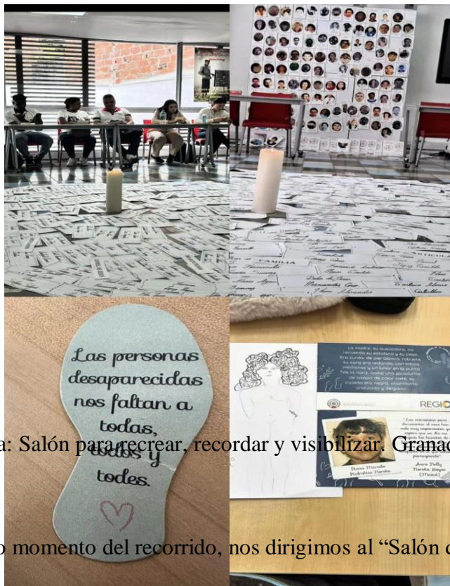
Espacio de memoria: Salón para recrear, recordar y visibilizar. Granada- Antioquia.

Este espacio es utilizado en el territorio para recibir a estudiantes, activistas y personas del común interesadas en conocer un poco más los rastros que deja el conflicto armado, permitiéndonos tener un momento de reflexión y de aprendizaje.