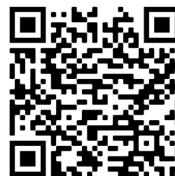
Figura 13 Caso 7

Síntesis del Caso 7 : A como consecuencia del odio que le generó el abandono de B, luego de buscarla incesantemente le dio muerte ahorcándola con sus manos.