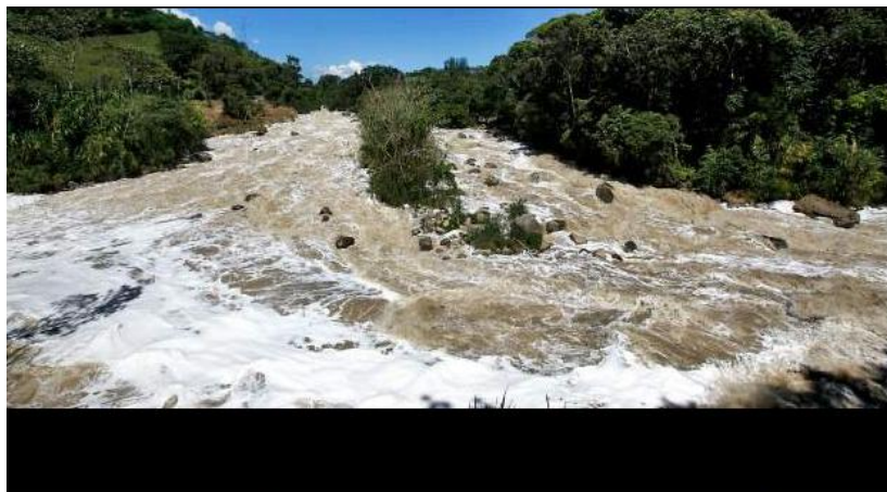
Antioquia no es eficiente en el manejo del agua | El río Medellín hacia Popalito (Barbosa). La cuenca del Medellín-Porce abarca

El río, que se encuentra después del municipio de Bello, lleva varios años en estado de contaminación y aunque se hayan tomado medidas preventivas, no son suficientes para combatir el problema. “He venido sobrevolando el río Medellín desde Caldas hasta Porce y siento dolor de patria cuando empiezo a observar la inhumana contaminación que está impactando el río después del municipio de Bello”, manifestó el mandatario antioqueño. (Kien y ke noticias, 2017)