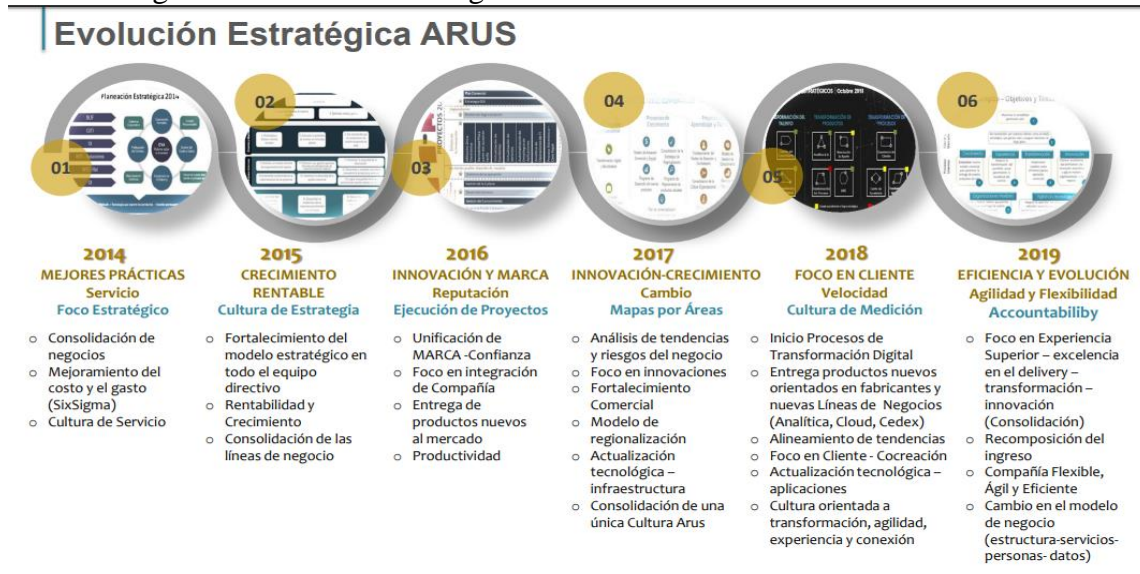
Imagen 2: Evolución Estratégica

A partir del 2016 se ejecutan varios proyectos que buscan mayor y mejor notoriedad en el mercado (Imagen 2).