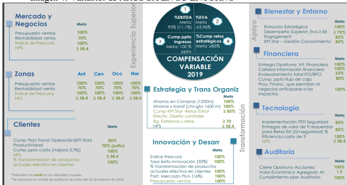
Imagen 4: Variables de ARUS SA EN SU ENTORNO

En la (Imagen 4) se pueden observar algunas variables económicas, que muestran su crecimiento interno.