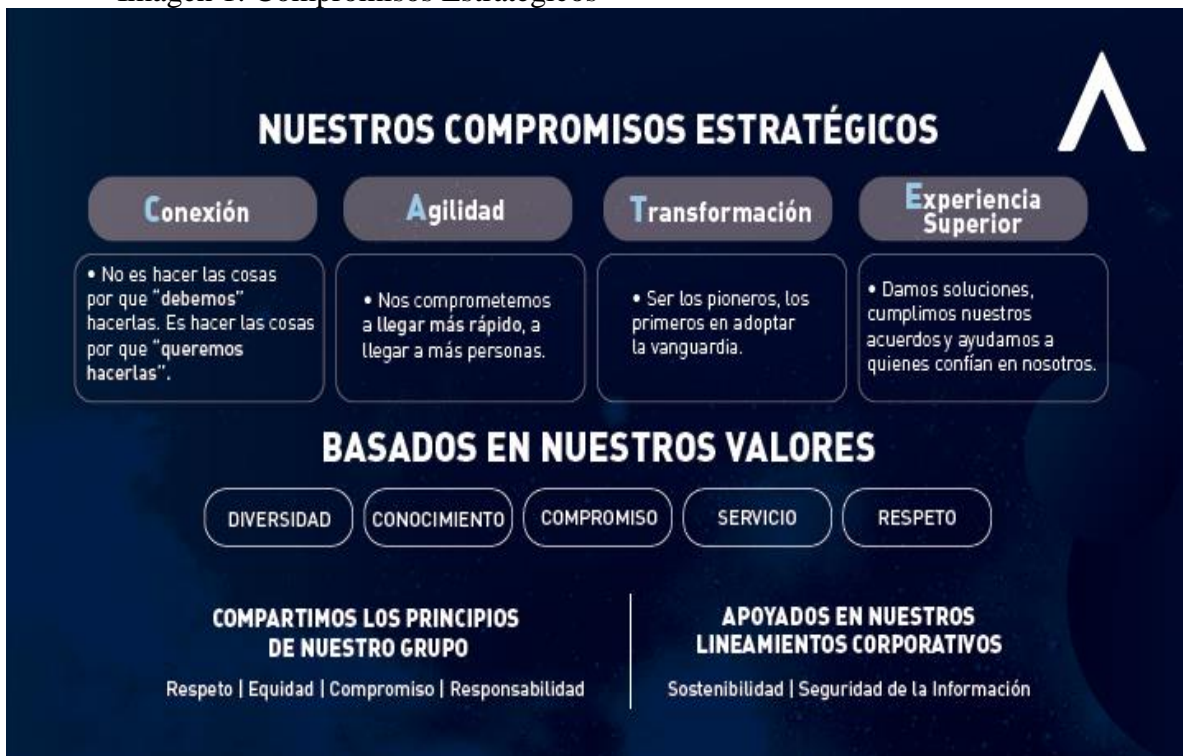
Imagen 1: Compromisos Estratégicos

Para llevar a cabo su operación, ARUS se encuentra comprometida con 4 compromisos estratégicos (imagen 1) conexión, agilidad, transformación y experiencia superior con el fin de asegurar la transformación de la operación garantizando la excelencia del servicio a los clientes.