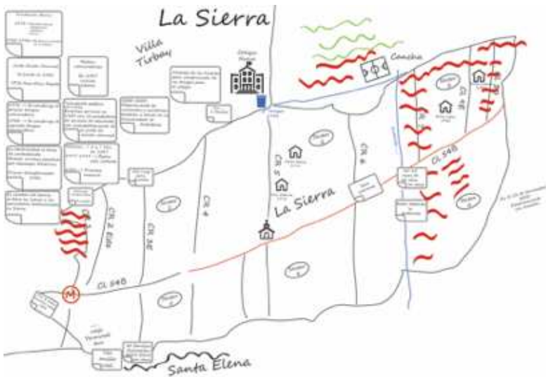
Gráfica 1: Digitalización de mapa cartográfico de poblamiento histórico realizado por líderes sociales y fundadores del barrio La Sierra de la Comuna 8 de Medellín. Año de realización 2018.

La comunidad construye, a partir de profundos arraigos de identidad con sus barrios, su propio mapa del territorio en un proceso por fases, en las cuales cada participante elabora las dimensiones del territorio por capas, empezando por la configuración histórica y por los lugares de referencia. Es decir, la Cartografía social se convierte en un proceso de activaciones de memoria que potencia las elaboraciones propias sobre los territorios.