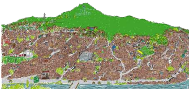
Ilustración: Archivo Corporación para la Comunicación Ciudad Comuna - Año 2014.

A pesar de ser considerada tradicionalmente como escenario del conflicto armado y social colombiano, de violencia, desigualdad y vulneración de los derechos humanos, la Comuna 8 es un territorio muy rico en procesos y movimientos sociales. Gracias a los procesos de participación y movilización social promovidos por las organizaciones sociales, la población logra un alto nivel de empoderamiento social, que desencadena debates políticos que visibilizan contradicciones y tensiones de las dos caras de Medellín: la ciudad innovadora, tecnológica y turística frente a la ciudad que emerge de las laderas, invisible a la planeación estatal donde la población, víctima de los procesos de desarrollo urbanístico, reivindica el derecho al territorio y la vida digna en barrios que las mismas comunidades desplazadas han construido solidariamente.