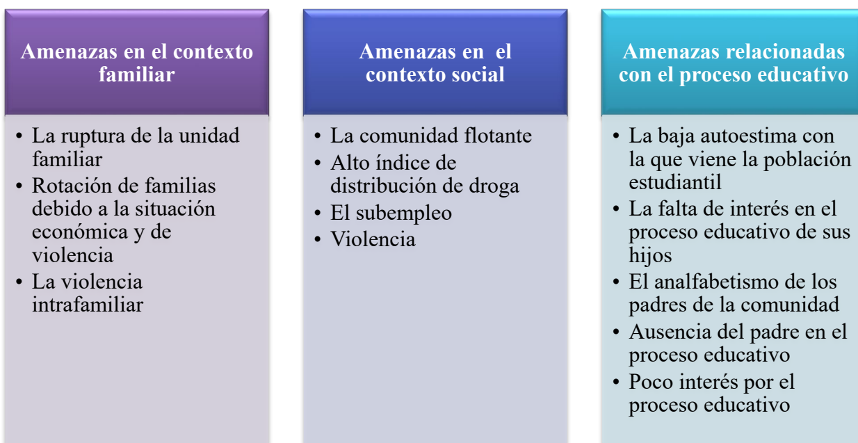
Figura 1. Amenazas relacionadas con la Institución Educativa Playa Rica.

Con relación al acceso a la cultura y la recreación, la Institución Educativa Playa Rica es la única entidad que puede ofrecer diversos cursos a los estudiantes en el horario de la jornada contraria a la que ellos estudian. Se destaca una buena oferta en la institución, incluyendo clases de: música, violín, canto, artes marciales, banda, danza, gimnasia, inglés, entre otros. De otro lado, el barrio no cuenta con otros espacios, como se mencionó anteriormente que ayuden a un mejor acceso a la cultura, la recreación o el deporte.