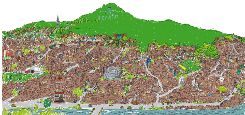
Figura 9.1. Vista panorámica de la Comuna 8 de Medellín.