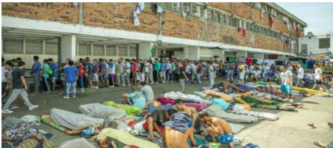
Figura 2. Hacinamiento que se vive Centro Penitenciario y Carcelario Bellavista

Nota. Tomado de Jaramillo & Cruz (2020, p. 151).